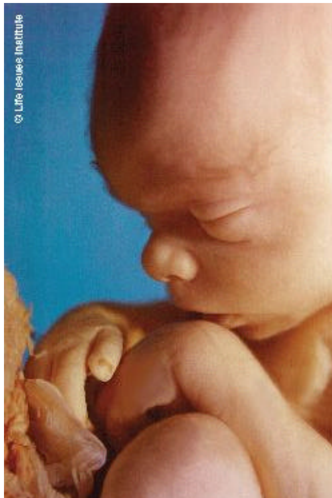
Ongeboren kind van 20 weken