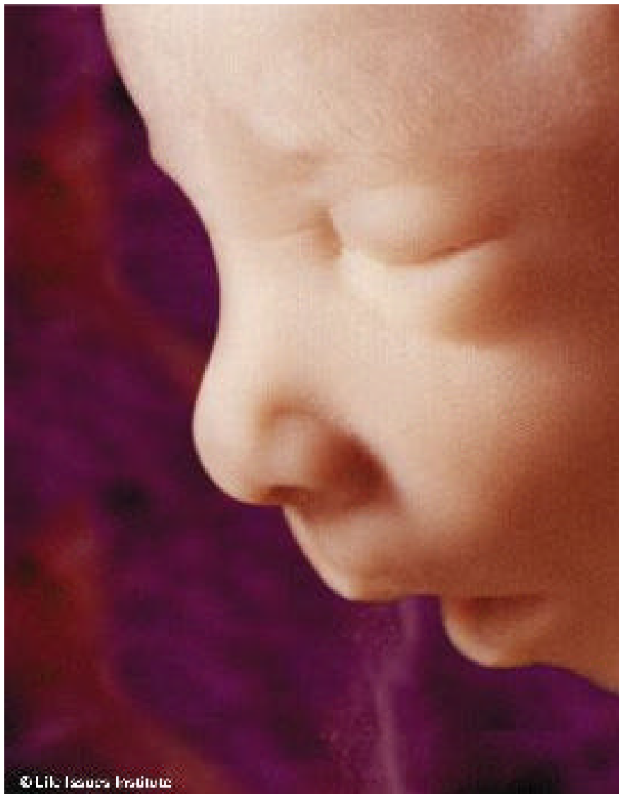
Ongeboren kind van 16 weken

De zogenaamde 0- en de 1-meting (de meting voor en na de hypnotherapeutische interventie) van dit onderzoek naar Introjecties ontstaan bij het ongeboren kind worden gepresenteerd in hoofdstuk zeven. Tenslotte worden conclusies aan de hand van de praktijkbevindingen getrokken en aanbevelingen gegeven in hoofdstuk acht.